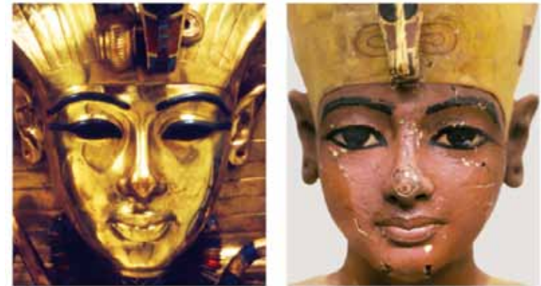
Fig. 60 Face 3 on the golden inner coffin (Cairo JE 60671, © Griffith Institute, University of Oxford) and Tutankhaten as young king (Cairo JE 60722, © Griffith Institute, University of Oxford)